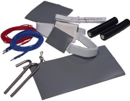
Abbildung: Elektroden zu Michelfelders Feinstromgerät